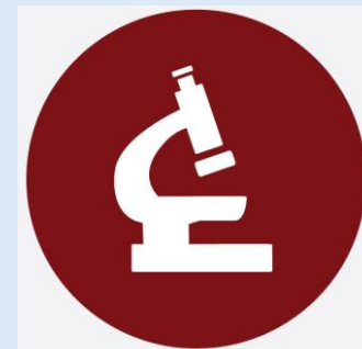
מצגות לאנשי מקצוע